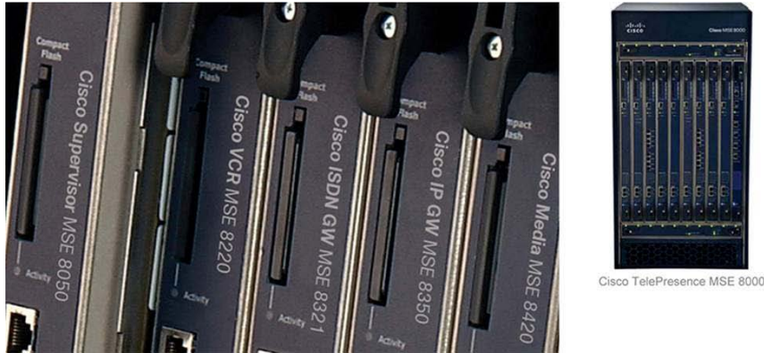
图 1. 思科网真 MSE 8000